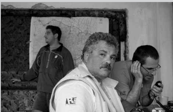
Στιγμιότυπα από τη διεξαγωγή της δράσης, μετην υποστήριξη των ΟΕΑ.