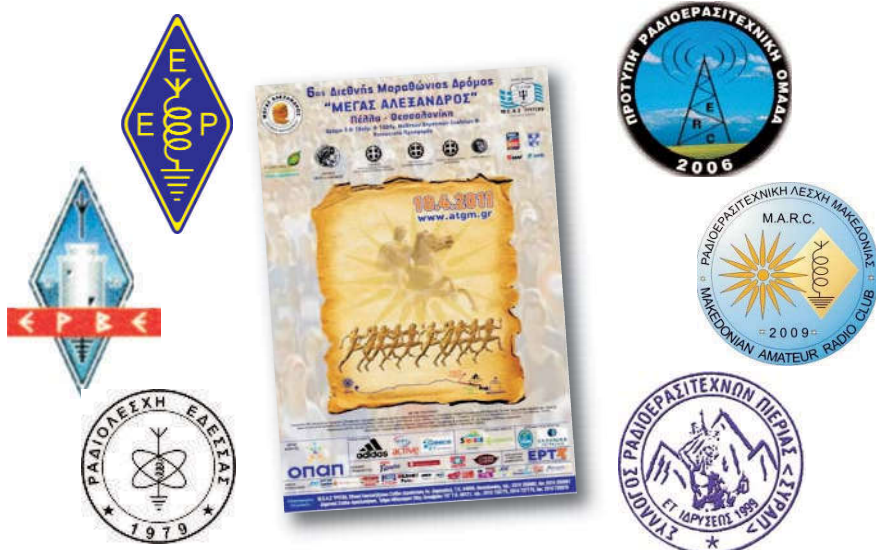
Η αφίσα του 6ου Διεθνούς Μαραθώνιου Δρόμου “Μέγας Αλέξανδρος” και τα εμβλήματα των Συλλόγων που υποστήριξαν τη διοργάνωση.