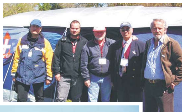
SV2YC SV2LLL SV2BBC