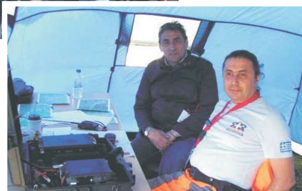
Συναντήσεις κι ετοιμότητα στο ΚΕΜ.