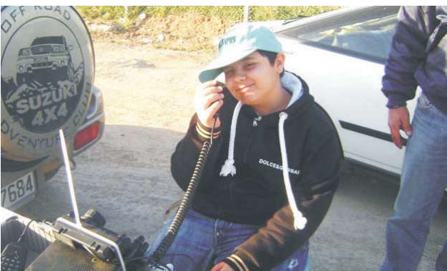
Ο SV2IPF junior.