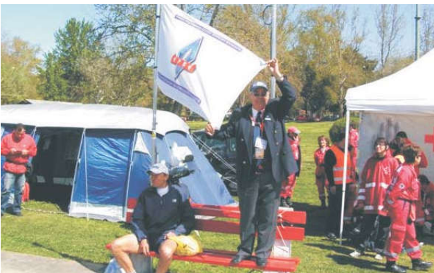
Ο SV2LLL μπροστά από το KEM.