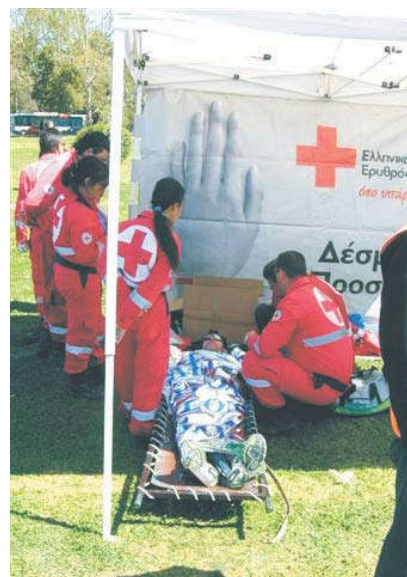
Πρώτες βοήθειες από τον ΕΕΣ.

Παρά τις δύσκολες καιρικές συνθήκες (δυνατός Βαρδάρης) που επεκράτησαν και δυσκόλεψαν το έργο των στελεχών και των εθελοντών της διοργάνωσης, οι επιδόσεις των δρομέων ήταν πολύ καλές.