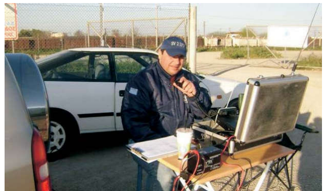
Ο SV2IPF επί τω έργω.