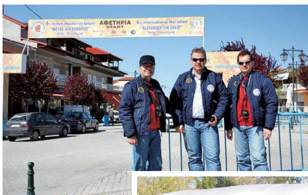
Οι SV2CSI- SV2CSV - SV2KBC στην αφετηρία του Μαραθώνιου.

Δεν είχε πολλές ημέρες που είχα εκλεγεί πρόεδρος της Ε.Ρ.Β.Ε. και