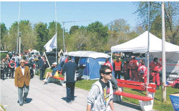
Το KEM (μπλε σκηνή) στο κέντρο.