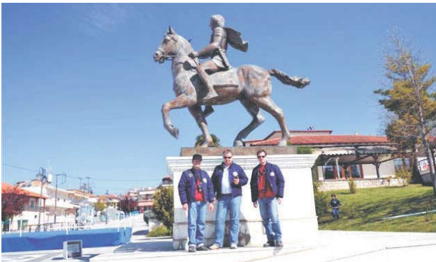
Οι SV2CSI - SV2CSV - SV2KBC στην αφετηρία.