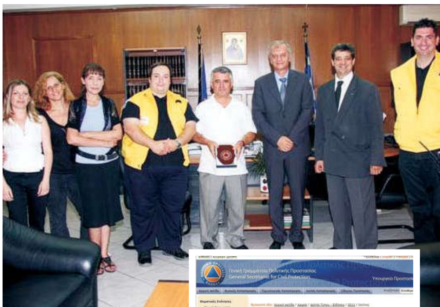
Δεξιά: Η ιστοσελίδα της ΓΓΠΠ η οποία αναφέρεται στην υπογραφή του μνημονίου.